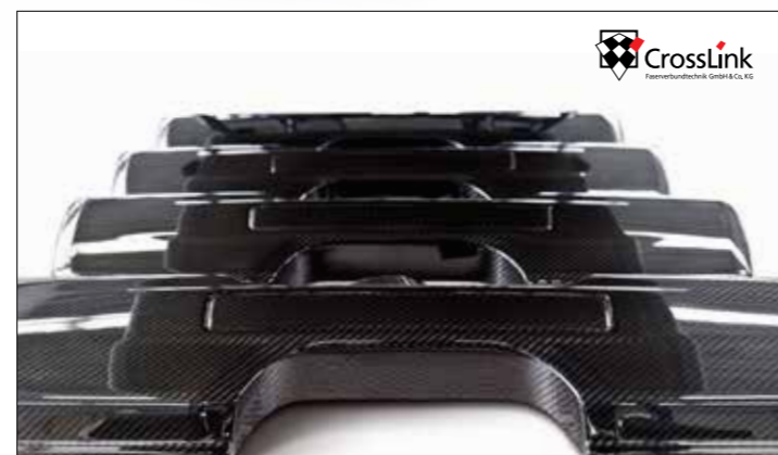
Anwendungsbeispiele Sample applications