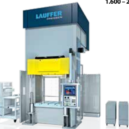
1.600 – 25.000 kN

Labor- und Versuchspressen Laboratory Presses